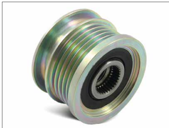
Снимка 2: Механизъм за свободен ход на генератор 535 0143 10

Като техническо решение Schaeffler Automotive Aftermarket за тези превозни средства предлага механизъм за свободен ход на генератор. Това намалява динамичното натоварване на задвижването на спомагателните възли и по този начин предотвратява шума.