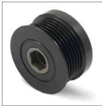
Фигура 1: Предишна конструкция