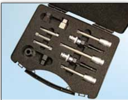
Снимка 3: Специализиран инструмент на INA, част #.400 0241 10

На Илюстрация 1 е показан производствен механизъм за свободен ход на генератор, която се монтира от съответния производител на превозното средство.