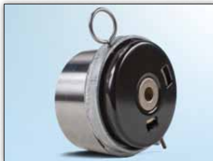
Снимка 3: Поглед отзад на предишния модел