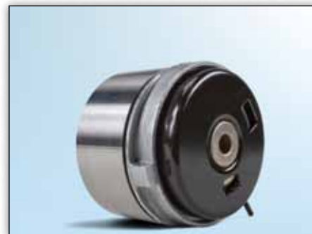
Снимка 4: Поглед отзад на новия модел

Поради непрекъснатото развитие на нашите продукти, конструкцията на обтяжната ролка 531 0779 10 бе променена. На тази Сервизна информационна листовка са показани визуалните разлики между двете конструкции (виж Илюстрация 1 и Илюстрация 2).