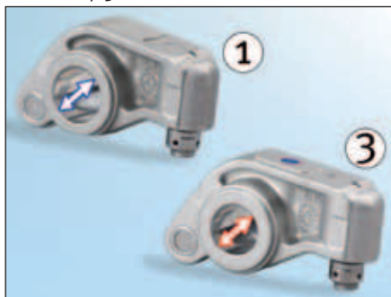
Фигура 2: Диаметърът на кобилиците от страната на всмукателните клапани е по-голям (1)

При монтаж, уверете се, че всяка кобилица е поставена на правилното място. Разлики между трите вида ролкови кобилици има както в диаметъра на отвора за опорната ос (Фигура 2), така и в извивката им (Фигура 3).