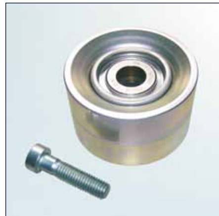
Снимка 2: 532 0410 20 – нова конструкция

Като част от непрекъснатите ни усилия за подобряване на нашите продукти, на отклоняващата ролка са извършени някои промени, позиция #.532 0410 20. Тази Сервизна информационна листовка показва визуалните характеристики на поранната конструкция и новата конструкция. Освен с приложени различен производствен метод и по-широката с 4 mm ролка, новата ролка е по-лека (тежи 657 грама в сравнение със старата ролка, която тежи 966 грама).