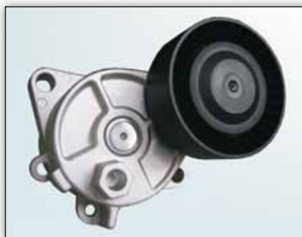
Снимка 1: 533 0015 10 (механична конструкция)