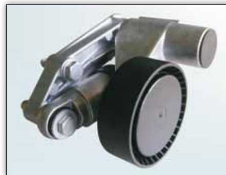
Снимка 2: 533 0097 10 (хидравлична конструкция)

Механичното обтягащо рамо 533 0015 10 (Илюстрация 1) в оригиналното оборудване е било заменено с обтегач с хидравлично демпфиране (Илюстрация 2). Като алтернатива Schaeffler Automotive Aftermarket предлага комплект за конверсия, който освен хидравличния демпфер съдържа всички необходими компоненти за преобразуване на механичния в хидравличен обтегач (Илюстрация 3).