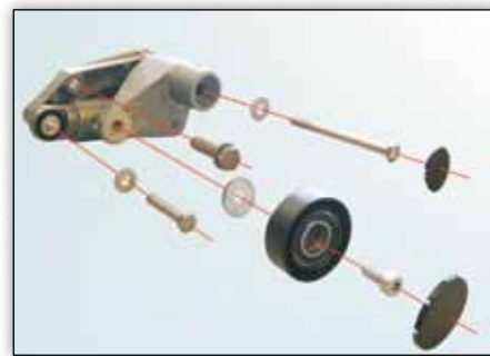
Снимка 3: 533 0097 10 — Комплектност на доставката

Механичното обтягащо рамо 533 0015 10 (Илюстрация 1) в оригиналното оборудване е било заменено с обтегач с хидравлично демпфиране (Илюстрация 2). Като алтернатива Schaeffler Automotive Aftermarket предлага комплект за конверсия, който освен хидравличния демпфер съдържа всички необходими компоненти за преобразуване на механичния в хидравличен обтегач (Илюстрация 3).