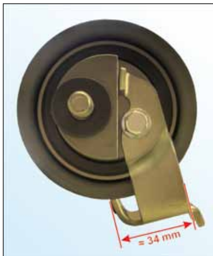
Снимка 1: 531 0399 20

531 0399 20 06B 109 243 (дейности) 531 0500 20 06B 109 243 F (дейности) 06B 109 243 D 06B 109 243 A