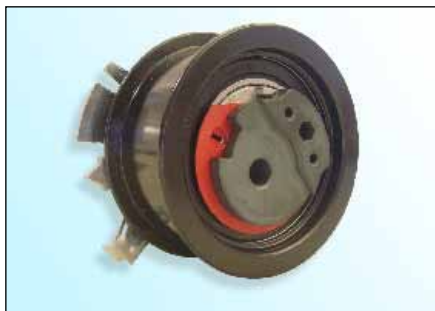
Снимка 1: 531 0628 30 (стария вариант)