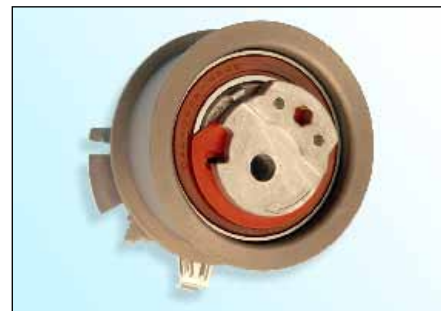
Снимка 2: 531 0628 30 (новия вариант)