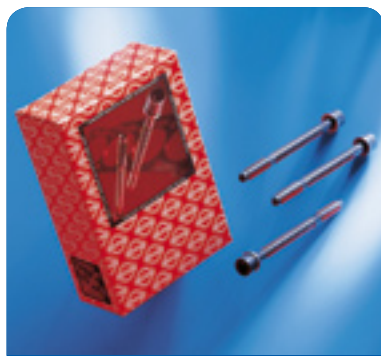
Болтовете за цилиндричните глави Elring се предлагат на пазара като комплект за съответното приложение.

Фирма Тех-Ко предлага на родния пазар широк спектър от цялостната продуктова гама болтове Elring. Всички компоненти са с доказан произход и в оригинална опаковка. Фирмата производител предоставя и подробна каталожна литература за 2007 г. Практичното ръководство е на разположение