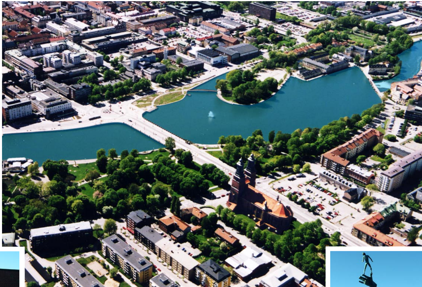
Flygfoto Kenneth Stenberg Stadsbyggnadsförvaltningen, Modellverkstaden Eskilstuna

Известен по-рано като "Градът на Карл Густав", Ескилстуна е център на много от най-популярните индустриални отрасли на Швеция. В началото на миналото столетие ОЈОР започна своята дейност тук.